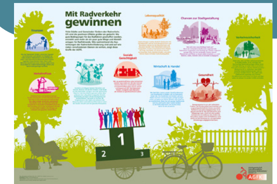
Jährlich bereitet die AGFK ein Radverkehrsthema grafisch in einem Poster auf. Grafik: K.Design

Einen besonderen Stellenwert hat die jährliche Fachtagung „Fahrradland Niedersachsen/Bremen“, zu der die AGFK gemeinsam mit dem Land Niedersachsen und der Hansestadt Bremen einlädt. Auch die Broschüre „Fahrradland Niedersachsen/Bremen“ stellt jährlich neue Entwicklungen und Best-Practice-Beispiele vor.