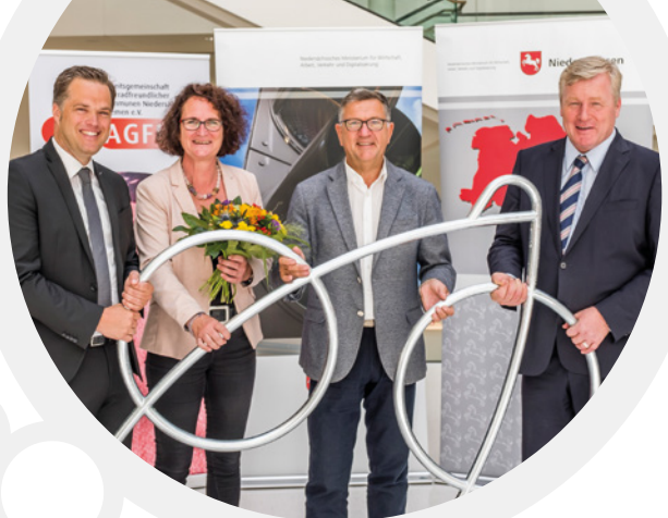
Als 50. Mitgliedskommune wurde die Stadt Hemmingen geehrt. Für Minister Dr. Althusmann ist die AGFK ein wichtiger Botschafter im Radverkehr.